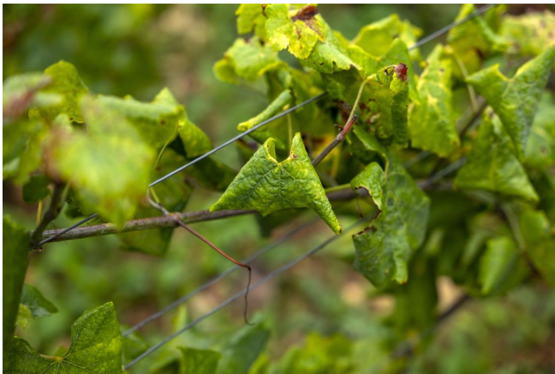
Symptômes de Flavescence