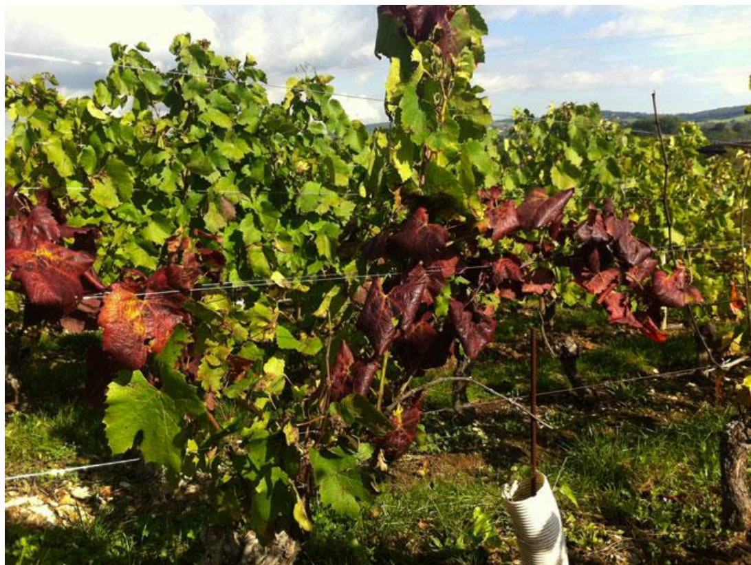
Symptômes de Flavescence