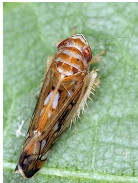
Adulte de Scaphoideus titanus

Des symptômes sont d'ores et déjà visibles.