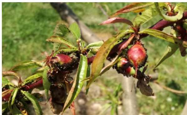
Puceron noir sur pêcher

Évaluation du risque : Risque en cours. A surveiller attentivement.