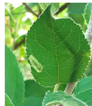
Dégâts de mineuses marbrées Photo CA82