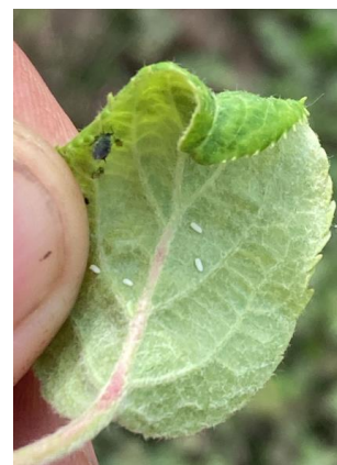
Foyer de pucerons cendrés et oeufs de syrphes

Évaluation du risque : le vol a démarré depuis le 25 mars, et semble en diminution.