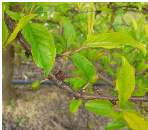
Prunier américano-japonais variété African Rose – Stade I 2024

Variétés tardives (Reine-Claude) : stades H