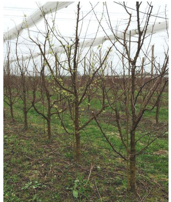
Arbre malade à feuillaison précoce

Techniques alternatives : L'application d'argile ou de BNA pro en barrière physique présente un intérêt en complément de l'arrachage des arbres malades. Elle est à réaliser avant le début du vol du psylle.