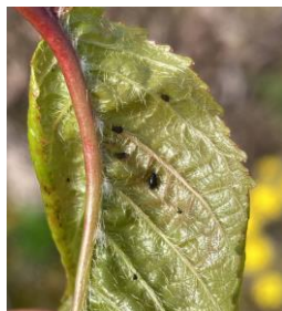
Petit foyer de puceron noir du cerisier

Évaluation du risque : Risque moyen. La période de risque a débuté avec l'éclosion des fondatrices et les premiers foyers. A surveiller.