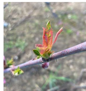
Cloque sur pêcher précoce – Photo Philippe Prieur 2024

Évaluation du risque : Fin du risque sur l'ensemble des variétés car le stade « premières feuilles étalées » est atteint partout.