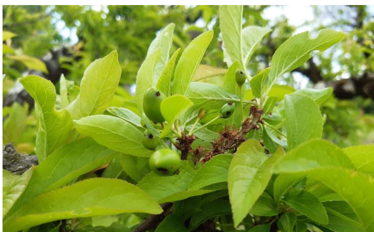
Dégâts d'hoplocampe sur Prunier américano-japonais – Photo J-F PLANAVERGNE 82 2024

Mesures prophylactiques : la lutte par pulvérisation de nématodes est conseillée au moment des toutes premières captures donc maintenant. Elle permet en théorie de limiter les populations et donc de diminuer l'usage des insecticides.