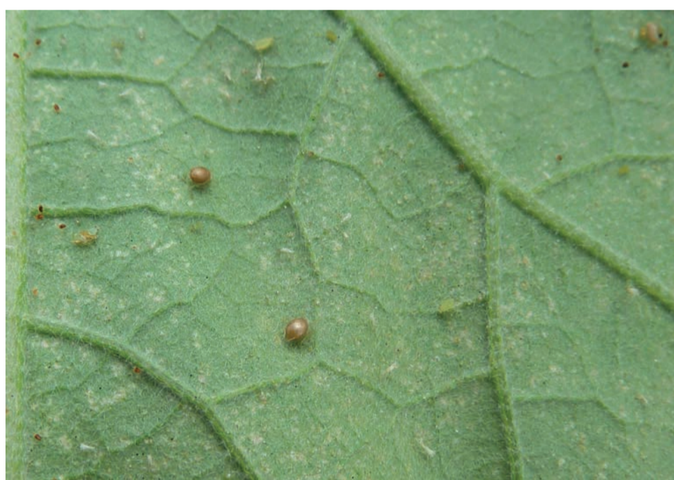
Présence de momies