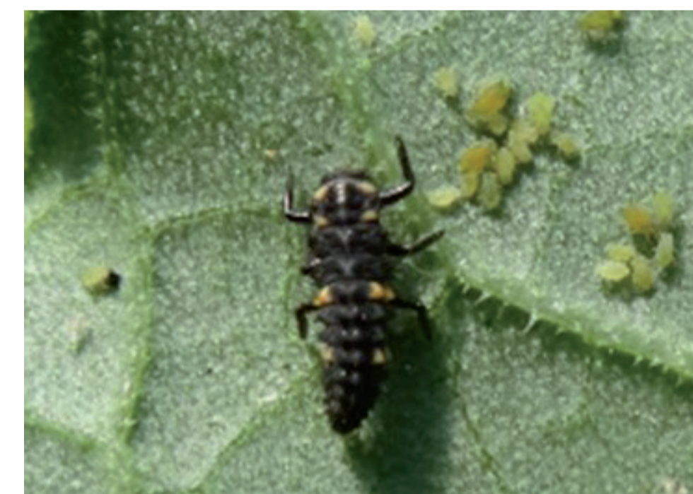
Larve de coccinelle