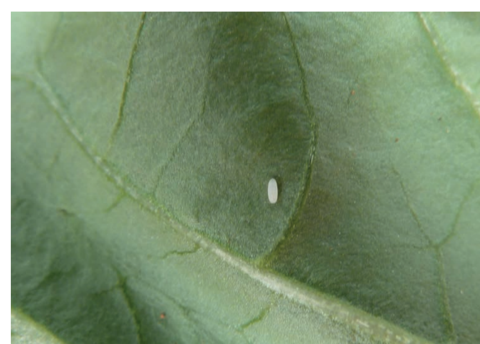
Œuf de Syrphe