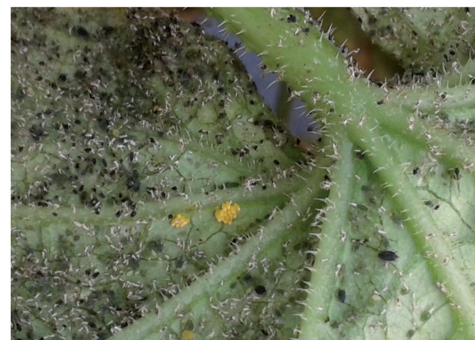
Œufs de coccinelle