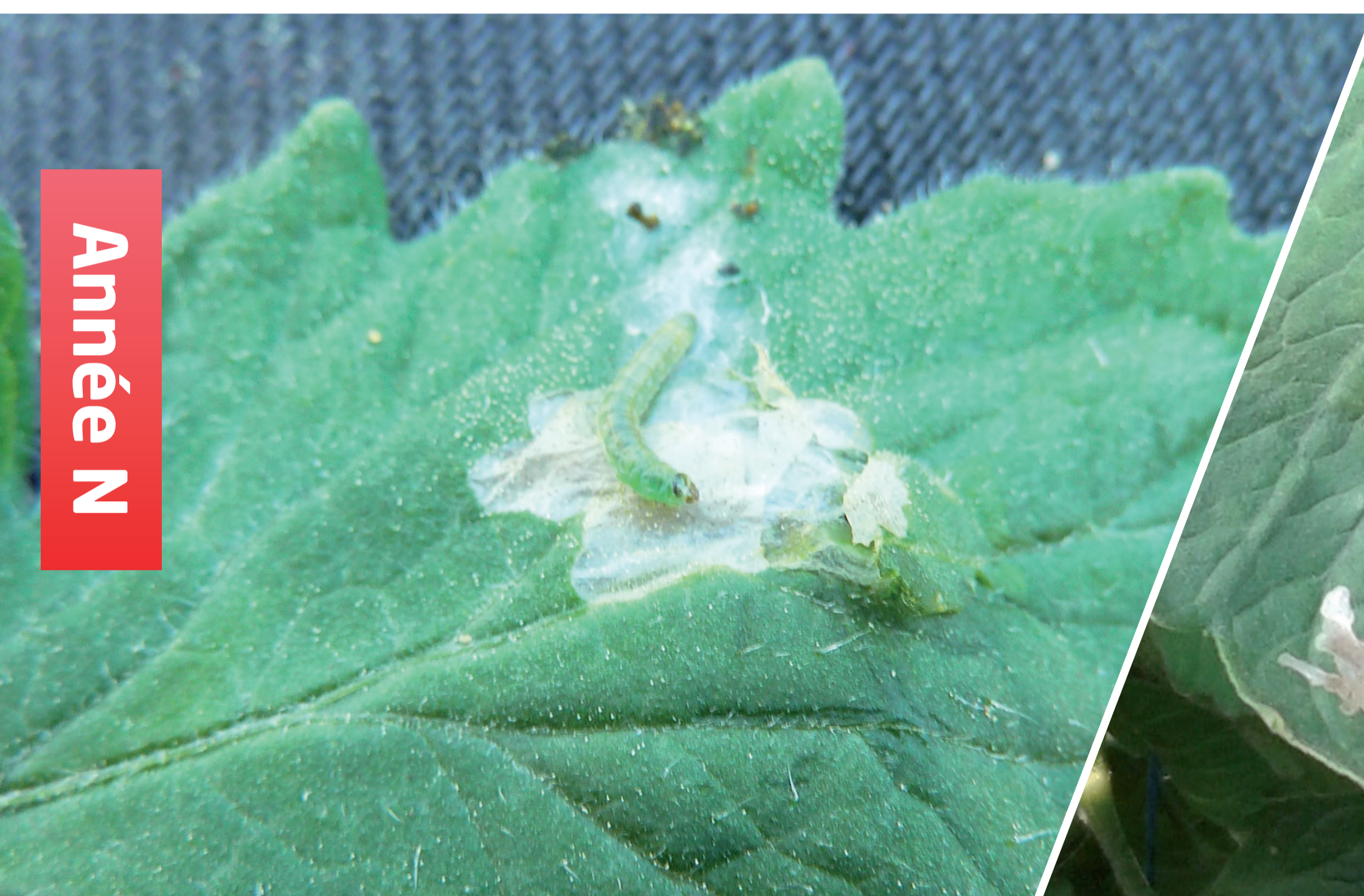
Chenille de Tuta absoluta