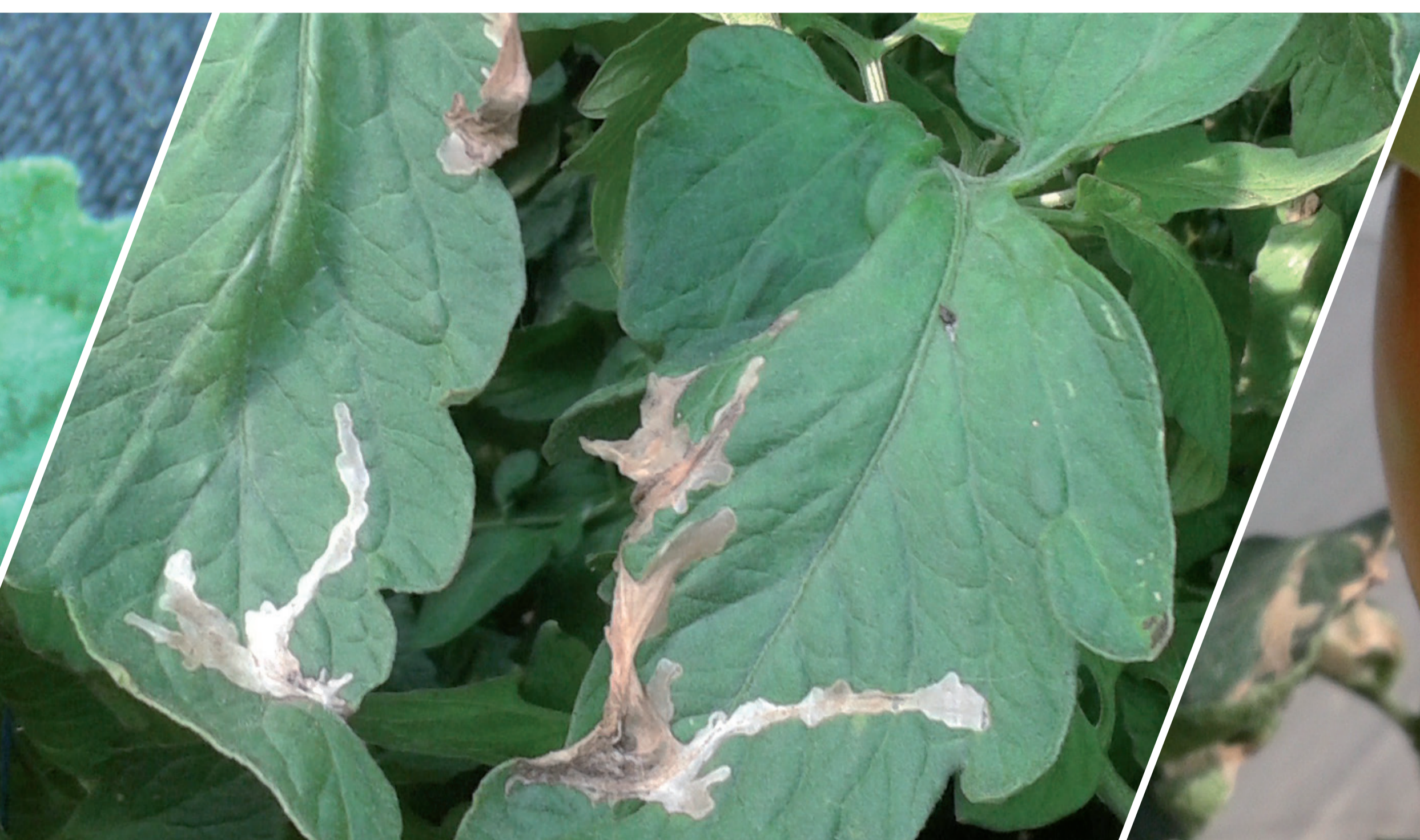
Dégâts sur des feuilles