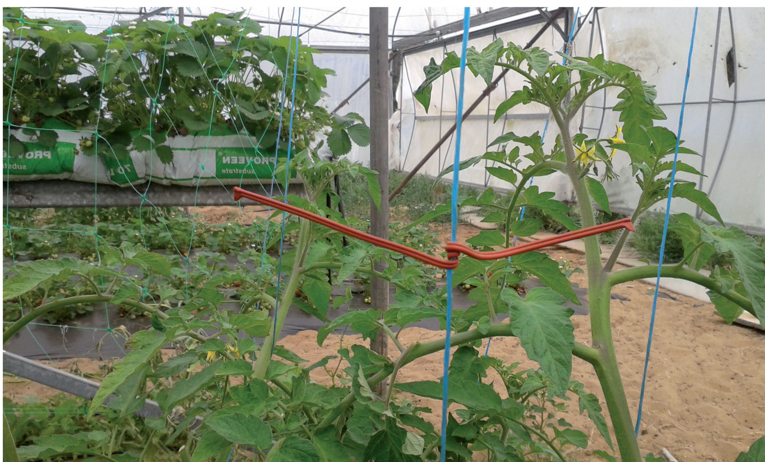
Fil confusion sexuelle ISONET