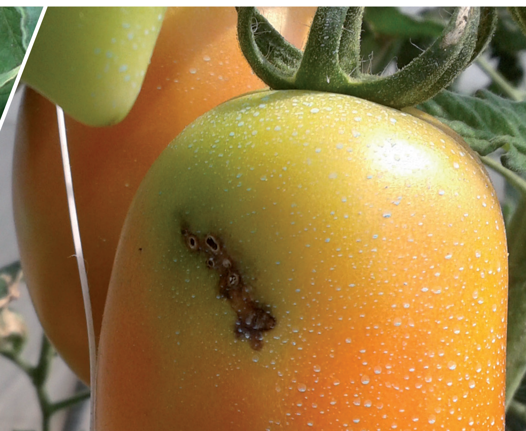
Dégâts sur des tomates