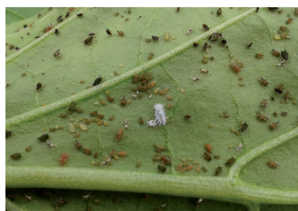
Larve de Scymnus