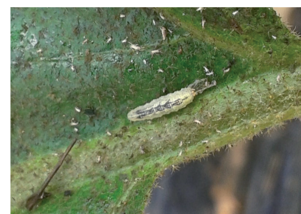
Larve de Syrphe