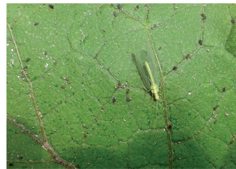
Adulte de Chrysope