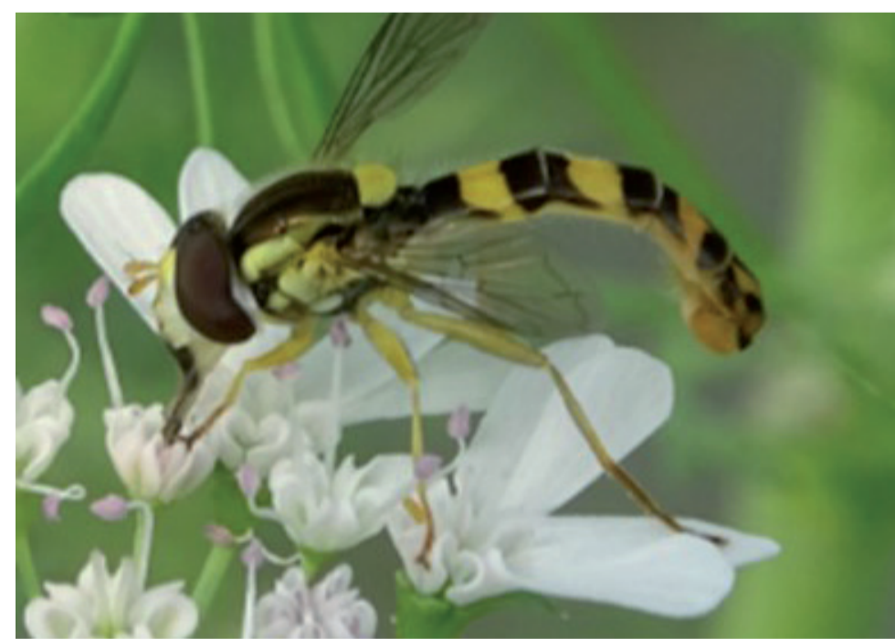
Adulte de Syrphe