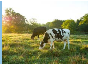
TABLEAU DE BORD DES VACHES ALLAITANTES

Un outil d'analyse de la productivité de votre troupeau. La Chambre d'agriculture des Hautes-Pyrénées comme chaque année, analyse les résultats des tableaux de bord vaches allaitantes (TBVA) pour l'année 2022.